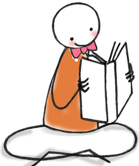
(io) ..... (leggere)