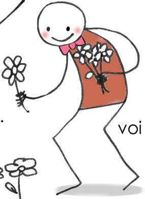
(loro) ..... (prendere) voi ..... (raccolgere)