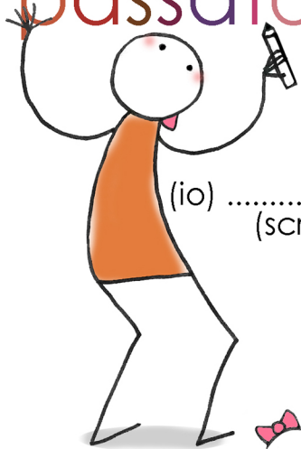
(io) ..... (scrivere)