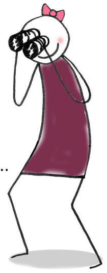
(tu) ..... (vedere)