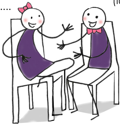
(loro) ..... (discutere)