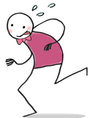
(lui) ..... (correre)