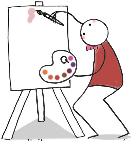
(lui) ..... (dipingere)