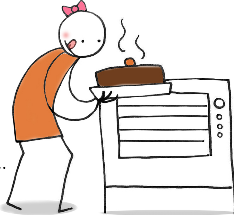
(lei) ..... (cuocere)